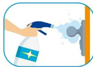
3 Limpiar las superficies de alto contacto