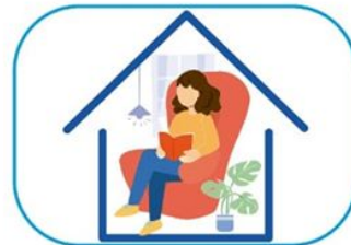
6 Quedate en casa